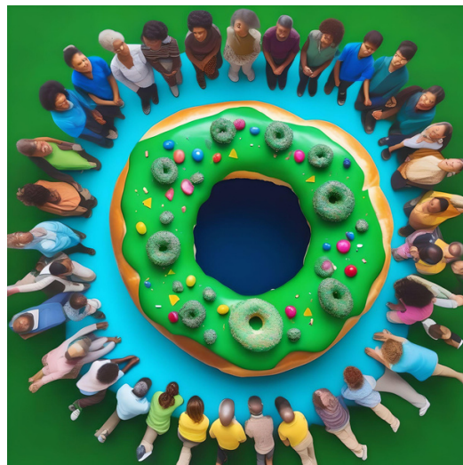
Imagen propia generada con IA

Hoy quiero hablar de la Dona, y no de la que se come, sino de un movimiento llamado la Economía de la Dona o Rosquilla. En mis últimos años estudiando y aprendiendo de movimientos y teorías nuevas sobre cómo hacer economía desde otra perspectiva, me encontré con la Dona, al principio me pareció un modelo abstracto, pero rápidamente fui comprendiendo a qué apuntaba y lo práctico que puede ser para ayudar a reflexionar y repensar nuestras maneras de vivir en la tierra.